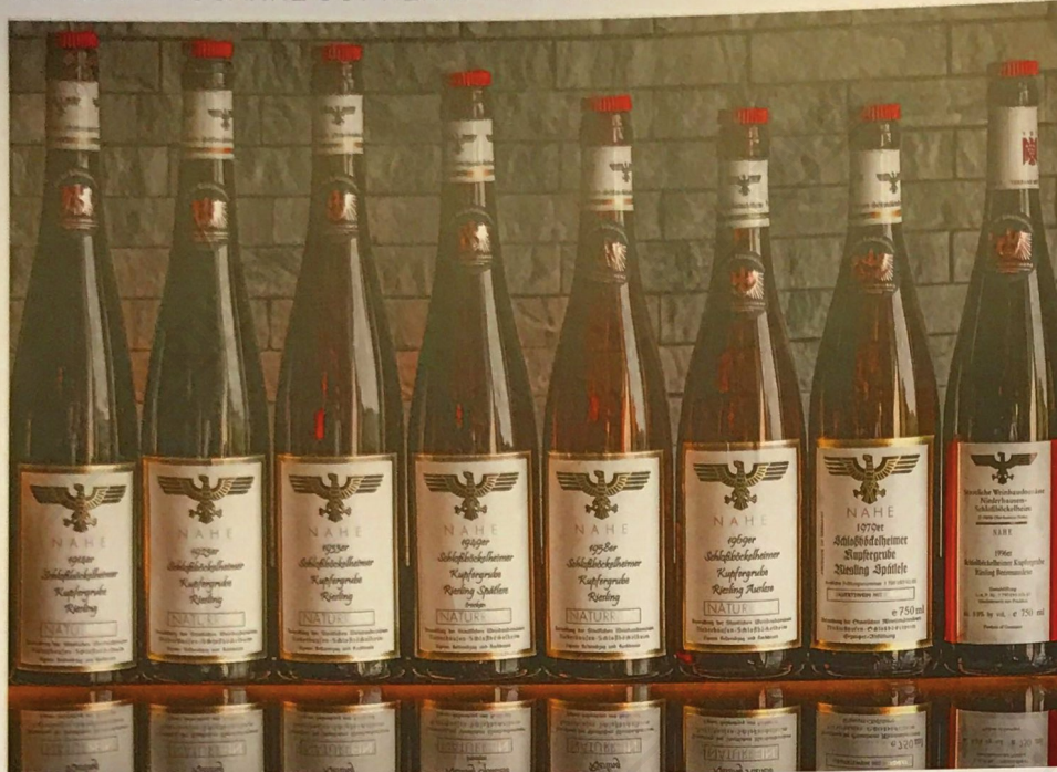
Drinking History: Anlässlich des 10-jährigen Jubiläums wurde zurück bis zum Jungfernjahrgang 1914 verkostet