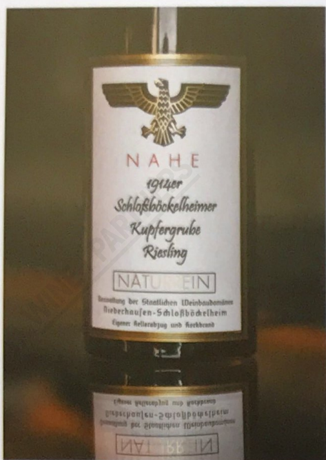
Jungfernjahrgang der Kupfergrube

Die Riesling-Erträge waren damals extrem schwankend dank starker Verrieselung während der Blüte. Im Bouquet süß mit Vanille und Toffee, Grüner Tee, gegrillte Marshmallows und Nougat überlagern die feinen Zitrusnoten nach kandierten Schalen und altem Zedernholz. Am Gaumen mit vibrierender Frische, feste Gerbstoffe, engmaschig, straff und sehnig, leptosomer Körper mit feiner Würze und fantastischer Länge. Leicht sahniges Finish mit würzig-zitrischem Nachhall. 17/20