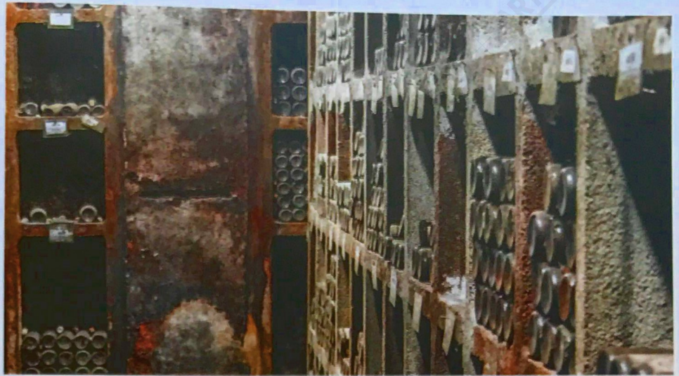
Im Keller von Gut Hermannsberg schlummern noch viele alte Schätze

Peters Prämissen im Keller ist maximale Zurückhaltung mit pingeliger Selektion beim Sortieren des Leseguts. Das langsame und safte Pressen in der alten Horizontalpresse ist entscheidendes Mittel für die Stilistik der Weine. Peter setzt dazu auf kurze Maischestandzeiten, um zu hohen Phenol-Eintrag in die Weine zu vermeiden. Gerade in den vergangenen Hitzejahren wurde das Gerbstoffmanagement immer wichtiger, da die Trauben zum Schutz zu immer dickeren Schalenbildung neigen. Der Jahrgang 2019 stellte wegen des hohen Schalentannins eine besondere Herausforderung dar, weshalb der Presssaft für die Finesse ausnahmsweise getrennt im Stahl ausgebaut wurde. Der Ausbau der Weine findet anteilig in Stahl und Holz statt (beide jeweils 600l), wobei Vorlauf und Presssaft nach der Vorklärung in der Regel zusammen vergoren werden. Die Gärung erfolgt durchweg spontan und die Philosophie begründet sich im Vertrauen auf die Güte der Weinberge. Im Keller gilt Minimalismus, es wird so viel weggelassen wie möglich, die Schwefelmengen wurden erheblich reduziert. Seit 2014 lässt man die Weine ein Jahr länger im Fass reifen, seit 2016 ganze zwei Jahre. Mit gutem Erfolg, denn mit dem Jahrgang 2017 stellte man mit der Bastei, dem Hermannsberg und der Kupfergrube auf volle 5-Jahre-Reifezeit um. Der 2017er Jahrgang wird also folglich erst 2022 auf den Markt kommen.