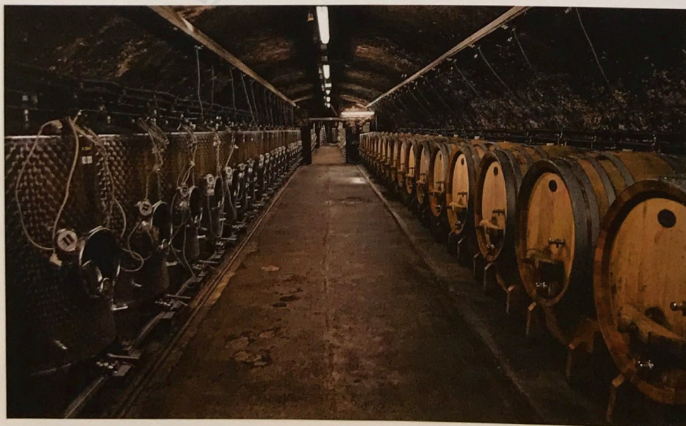
Stahl und Fuder sind die Gebinde der Wahl

2005 Schlossböckelheimer Kupfergrube Riesling Auslese: Grünliche Reflexe, Quitte, reife Frucht, Pfirsich, warmes Jahr. Karsten